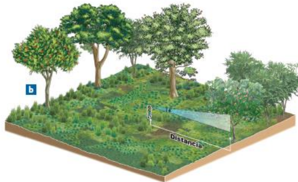
Figura 1.3. Transectos de inspección visual y auditiva para monitoreo de aves

Transectos de observación: Para la caracterización de la avifauna se realizaron transectos de observación a lo largo del área de influencia directa del proyecto, los cuales consistieron en la realización de recorridos diurnos con una distancia de 150 m dentro de las estaciones de muestreo de 500 m, abarcando las diferentes coberturas vegetales presentes en el área ( Figura 1.3 ).