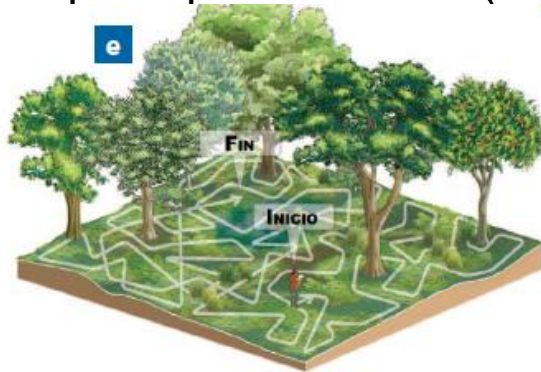
Figura 1.2. Diseños de transectos para muestreo de anfibios y reptiles mediante la técnica de inspección por encuentro visual (VES)