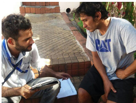
Cliente de Credicédula participando en una encuesta.