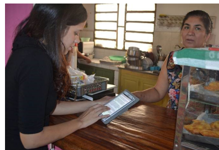
Ciente de Credicédula participando en una encuesta.

En Paraguay, sólo el 31% de los adultos tiene una cuenta con una institución financiera formal, comparado con un promedio regional de 54%. Además, sólo el 13% de los paraguayos declaran haber obtenido crédito de una institución financiera formal en el último año. 2 Estas cifras empeoran cuando se trata de personas con ingresos más bajos y sin historial crediticio.